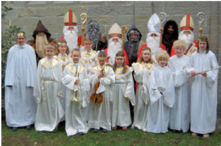
Seit einigen Jahren begleiten Kinder als musizierende Engel die Nikolaus-/Ruprecht-Paare.

ZF-Mitarbeiter pflegen in ihrer Freizeit das Nikolaus-Brauchtum