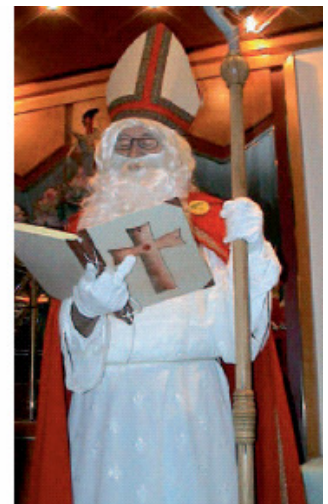
Fingerspitzengefühl ist gefragt, wenn der Nikolaus aus seinem Namensbuch die guten Taten der Anwesenden vorliest und schlechtes Verhalten tadelt.

Jugendgruppen sowie Alten- und Pflegeheimen. Auch in vielen ZF-Abteilungen hat die Nikolausgilde schon zur Gestaltung von Weihnachtsfeiern beigetragen. Dass der heilige Nikolaus auch von den Kleinsten als Wohltäter wahrgenommen wird, ist ein erklärtes Anliegen. Um keine Distanz zu den Kindern entstehen zu lassen, würdigt Nikolaus die guten Taten im Gespräch mit ihnen, während Knecht Ruprecht gegebenenfalls milde tadelt. Keinesfalls wollen die Besucher jedoch Erziehungsfunktionen ausüben oder die Kinder ängstigen.